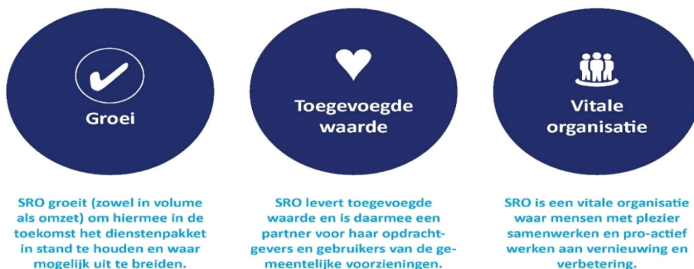
Figuur 1 De drie ambities van SRO

Ons strategisch plan 2020-2022 bevat de volgende drie ambities.