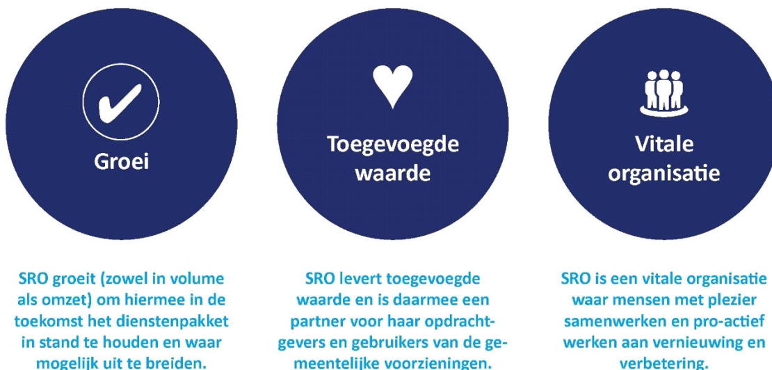
Figuur 1 De drie ambities van SRO

Ons strategisch plan bevat de volgende drie ambities.